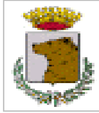
Comune di Capurso