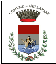
Comune di Cellamare