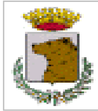
Comune di Capurso