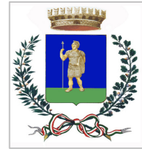
Comune di Valenzano

In relazione al D.Lgs. n. 196/2003 riguardante la "Tutela delle persone e di altri soggetti rispetto al trattamento dei dati personali", i dati verranno inseriti nei nostri archivi ed utilizzati esclusivamente per le procedure di gara.