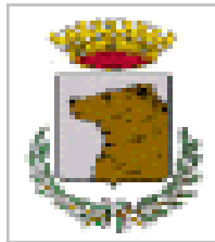
Comune di Capurso