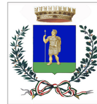
Comune di Valenzano