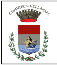
Comune di Cellamare