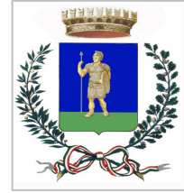
Comune di Valenzano