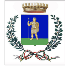
Comune di Valenzano

Nella busta "B" documentazione tecnica devono essere contenuti, a pena di esclusione dalla gara, i seguenti documenti: relazione illustrativa , sottoscritta dal soggetto legittimato ad impegnare la ditta nei confronti di terzi, in cui siano descritti marcature e/o certificazioni, modello e caratteristiche degli arredi e delle attrezzature che si intendono fornire; oltre a deplianti illustrativi degli arredi e delle attrezzature che saranno fornite,