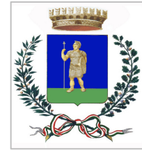
Comune di Valenzano

Il Plico deve contenere, pena l'esclusione , tre buste, a loro volta sigillate con ceralacca e controfirmate sui lembi di chiusura, recanti l'intestazione del mittente e la dicitura, rispettivamente "A – Documentazione amministrativa", "B Documentazione tecnica" e "C Offerta economica".